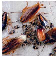
Kackerlackor i 100%

Kackerlackan är ett utpräglat nattdjur med kraftiga, taggiga ben och gömmer sig snabbt när ljuset tänds. Den trivs i trånga utrymmen och förökar sig snabbt.